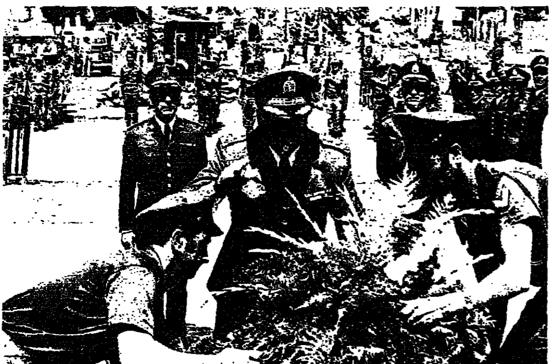
فائد الجيش يضع اكليلاً من الزهر على نصب الجندي المجهول والى جانبه رئيس الاركان